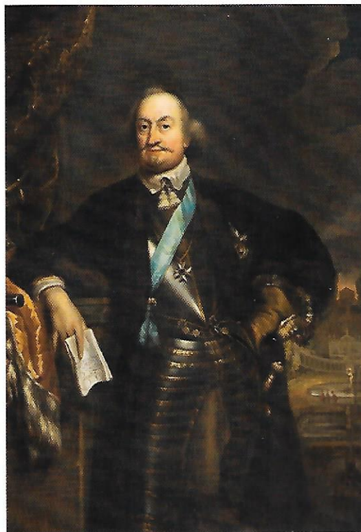
Portret van Johan Maurits door Jan de Baen, ca. 1668-1670.

Expositie: het Mauritshuis in Den Haag worstelt de laatste jaren met zijn naam vanwege het slavernijverleden van naamgever Johan Maurits van Nassau-Siegen (1604-1679). Het museum werd in de zeventiende eeuw gebouwd als stadspaleis in opdracht van Johan Maurits, die als gouverneur van de West-Indische Compagnie een tijd in Brazilië verbleef. In de expositie Bewogen Beeld – Op zoek naar Johan Maurits houdt het Mauritshuis zijn eigen collectie tegen het licht om zo inzicht te geven in de verschuiving van ons beeld over de naamgever van het museum. Te zien van 4 april tot en met 7 juli. www.mauritshuis.nl ■